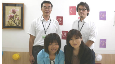
スタッフ一同お待ちしております！