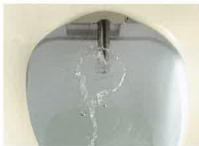
透明な板に水流を当てた画像です。